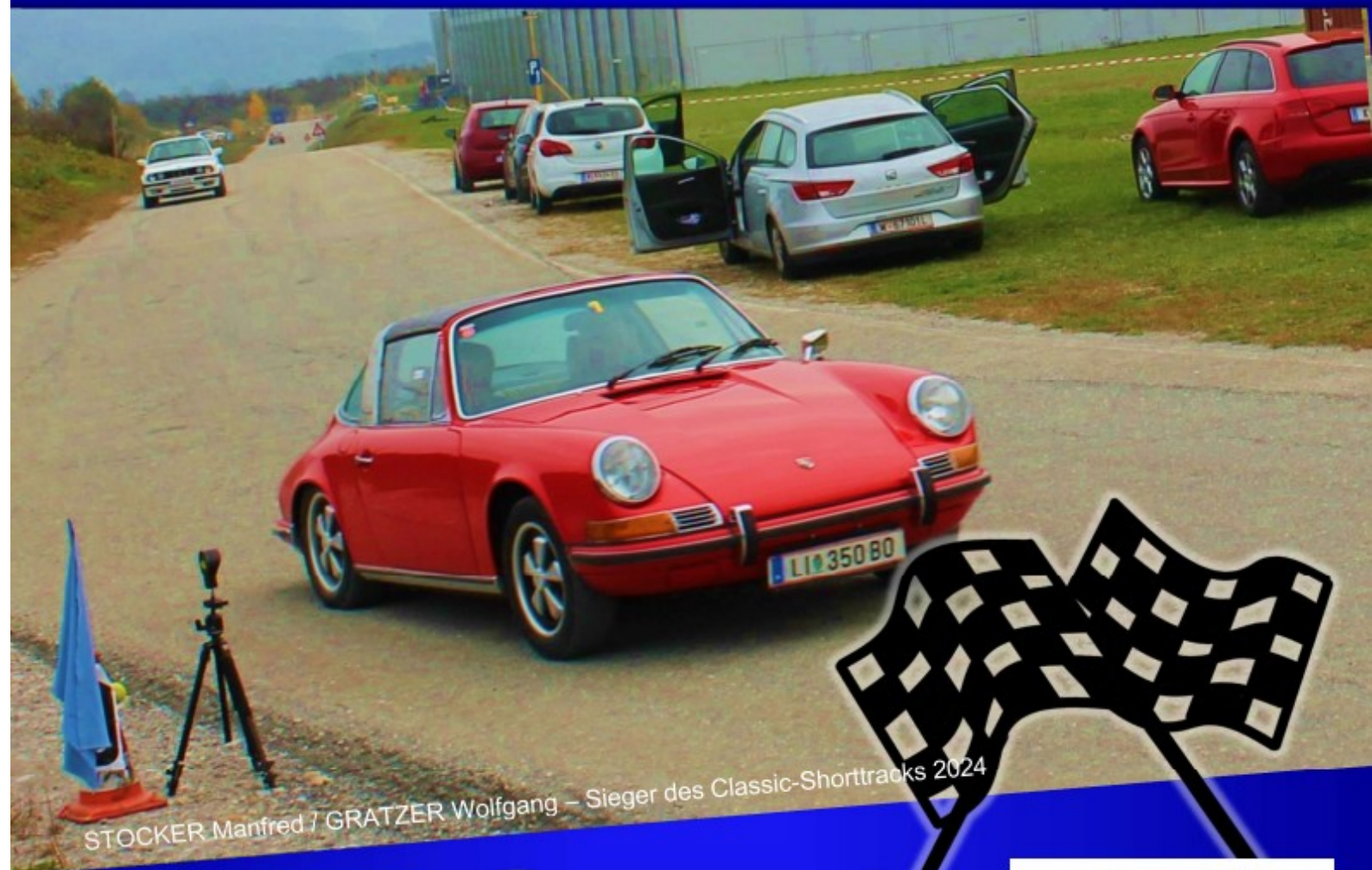
STOCKER Manfred / GRATZER Wolfgang – Sieger des Classic-Shorttracks 2024